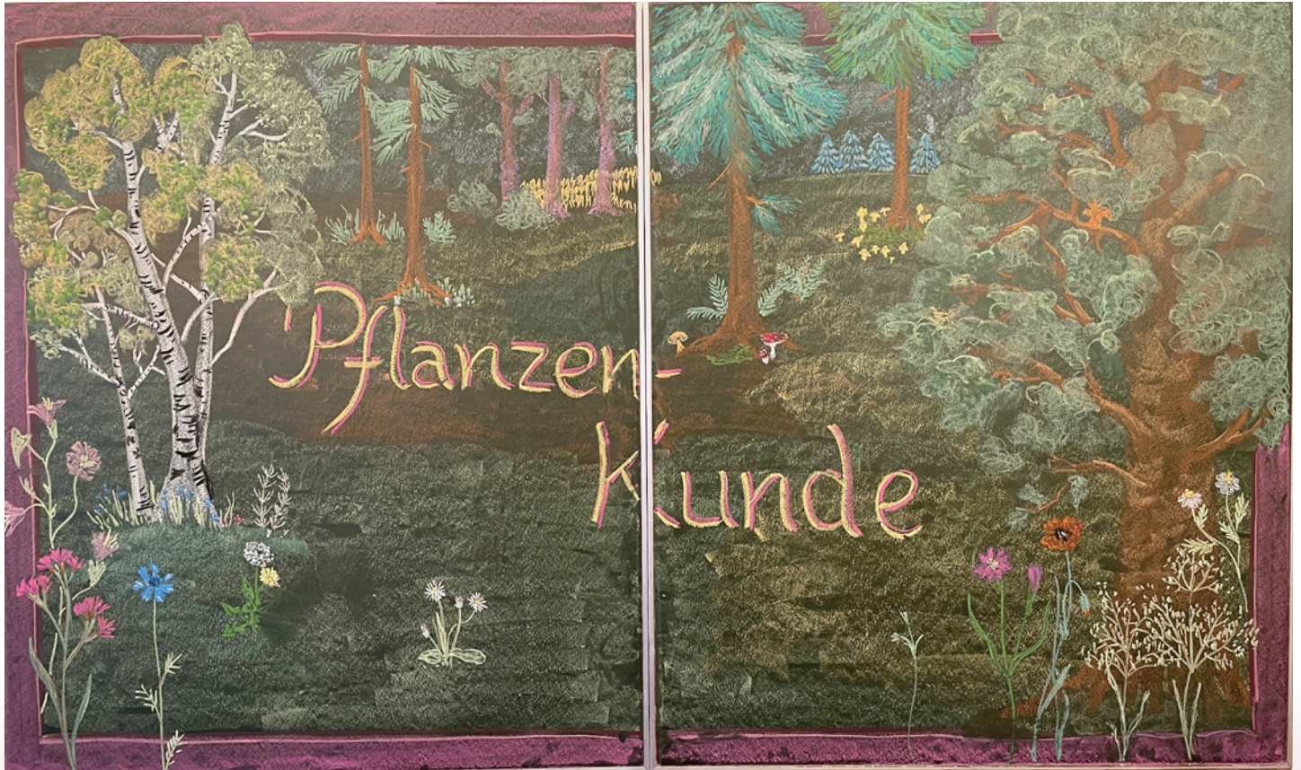
Tafelbild der 5. Klasse, gemalt von Heidi Tillmann.